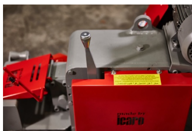
Leva per il taglio