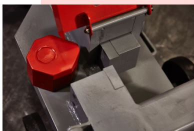
Riscontro mobile regolabile