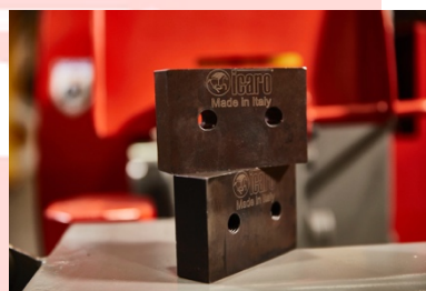
Set di lame in acciaio