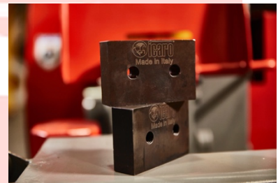
Set di lame in acciaio