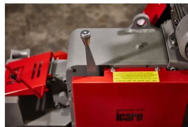
Leva per il taglio