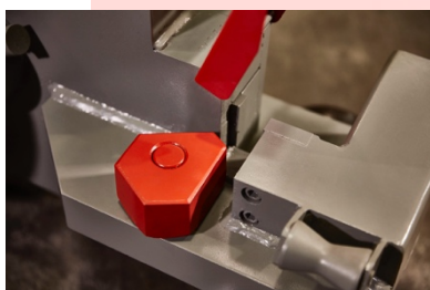
Riscontro mobile regolabile